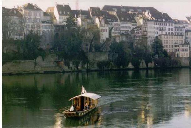
mit der Personenfähre über den Rhein in Basel